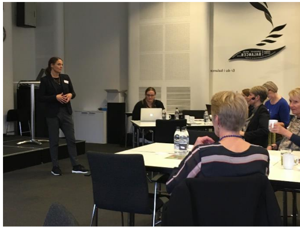
Formanden byder velkommen