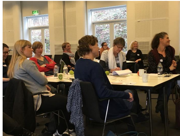
Opmærksomme og deltagende medlemmer